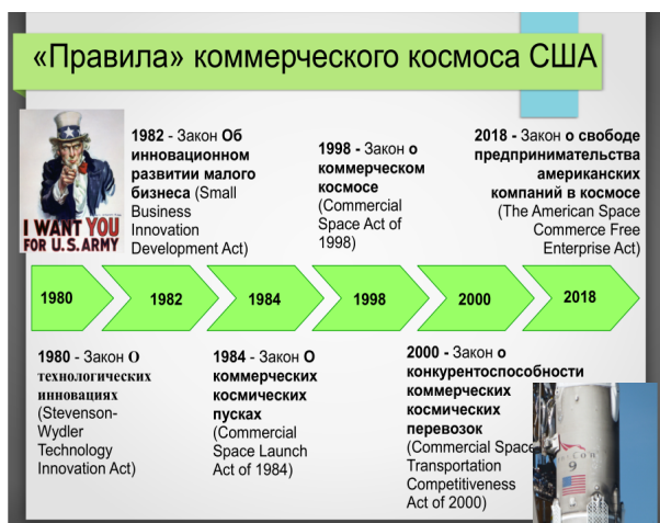
Рисунок 3: Развитие законодательства США о космических инновациях

В 1980 году принимается Закон Стивенсона-Вайдлера « О технологических инновациях » (Stevenson-Wydler Technology Innovation Act of 1980). Закон направлен на стимулирование частной инновационной деятельности граждан и организаций в США. Основной задачей закона служило ускорение развития экономики и наукоемких отраслей промышленности через механизм передачи частным организациям засекреченных разработок и технологий, которые способствовали технологическому росту страны в целом. При этом, главная роль в этих процессах отводилась малому бизнесу, как наиболее подвижной части экономики.